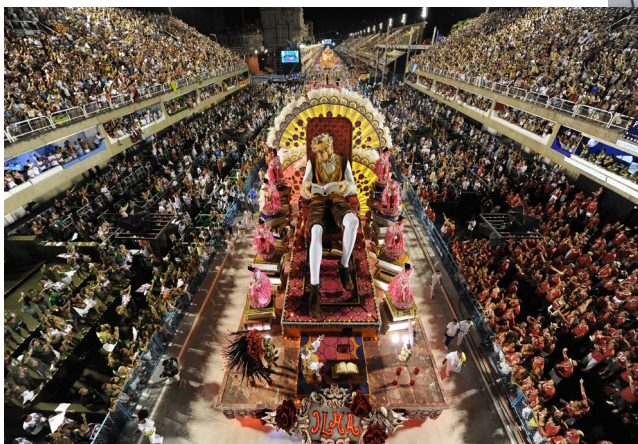
Rio de Janeiro. Na svetoznámy karneval sa chodia pozerať milióny ľudí.