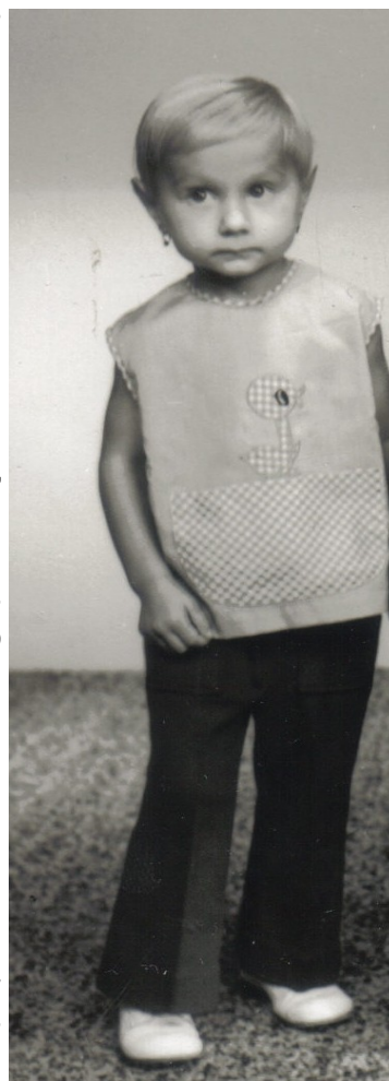
Pani učiteľka ako 3,5 ročná a na snímke dole so svojimi prvákmi

- Na gymnáziu bolo fajn. Mali sme super triedneho, ktorý bol taký starší pán a vždy nás bral ako také „drobce“. Bol k nám naozaj veľmi milý. Na škole som si našla super kamarátky, s ktorými udržiavam kontakt dodnes.