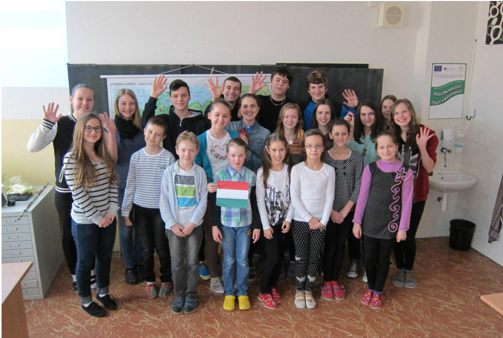
Kto sú naši susedia (alebo deviataci učili štvrtákov)