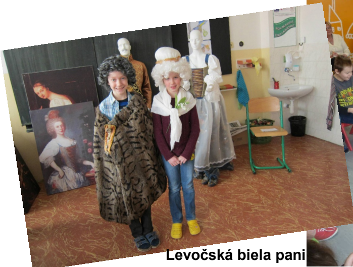
Levočská biela pani