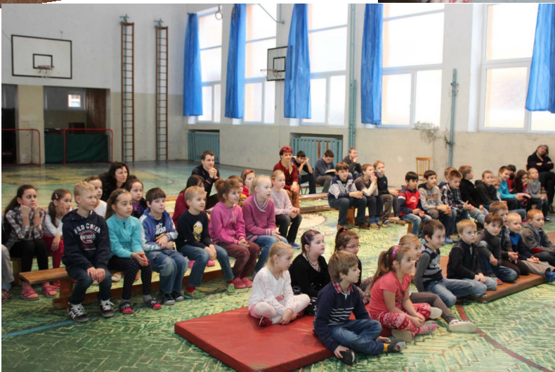
Predstavenie Ujo ETOS