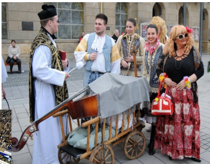
Pochovávanie basy. Tento ľudový zvyk ukončil fašiangové obdobie